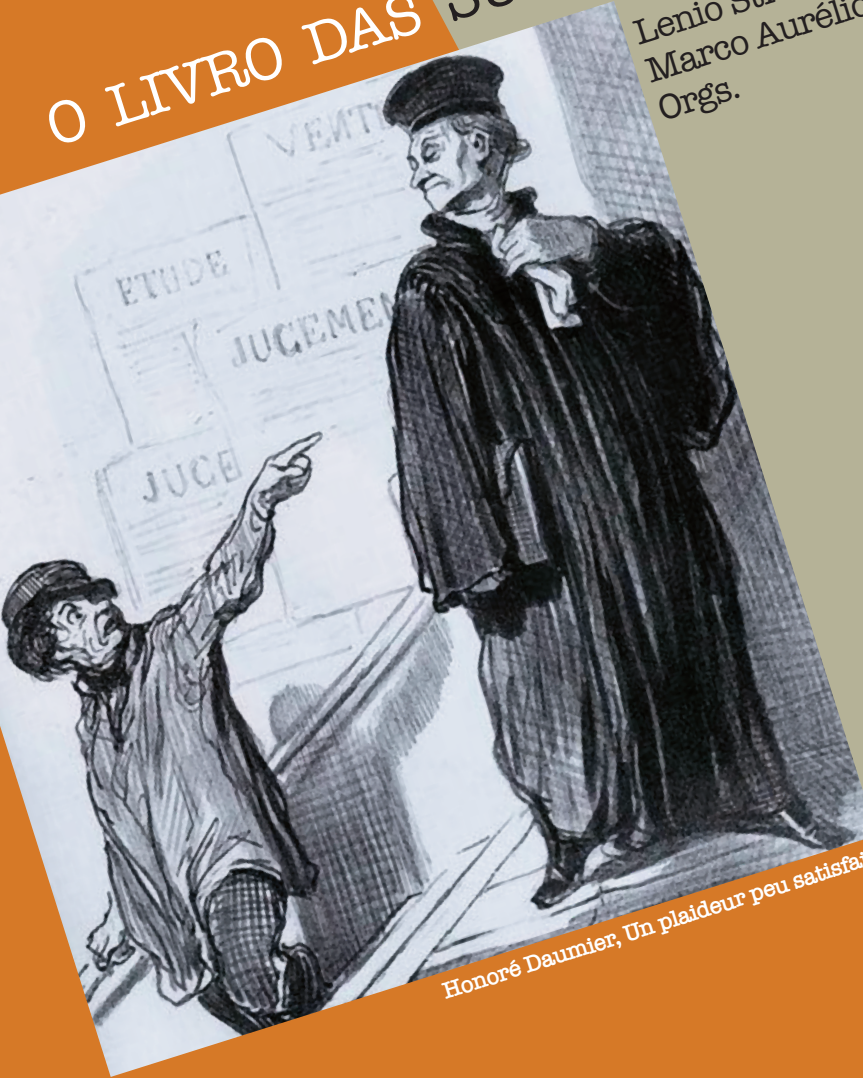
Honoré Daumier, Un plaideur peu satisfait

O que fazer quando sabemos que sabemos que Moro era parcial e suspeito?